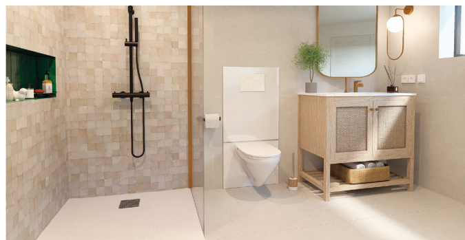
Le Saniwall Up Evo à carreler.